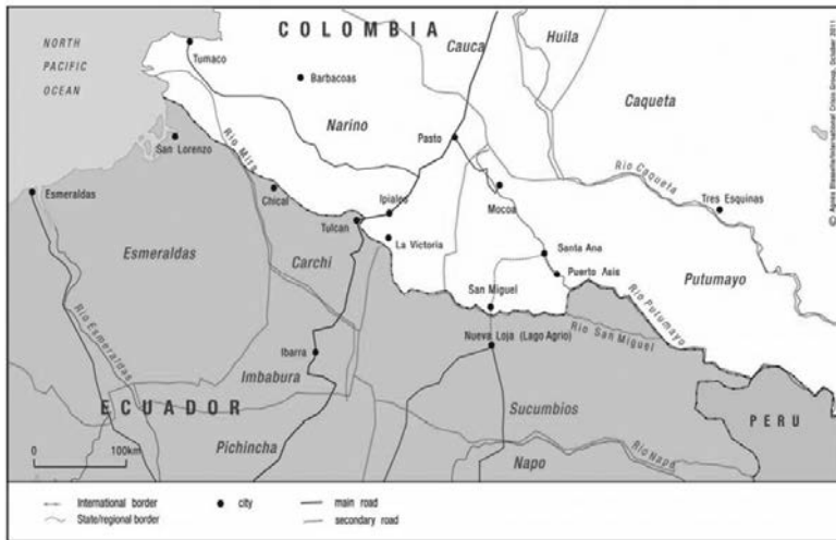
Mapa 1. Frontera Colombia-Ecuador

International border = frontera internacional State/regional border = frontera estatal/regional City = ciudad Main road = carretera principal Secondary road = carretera secundaria